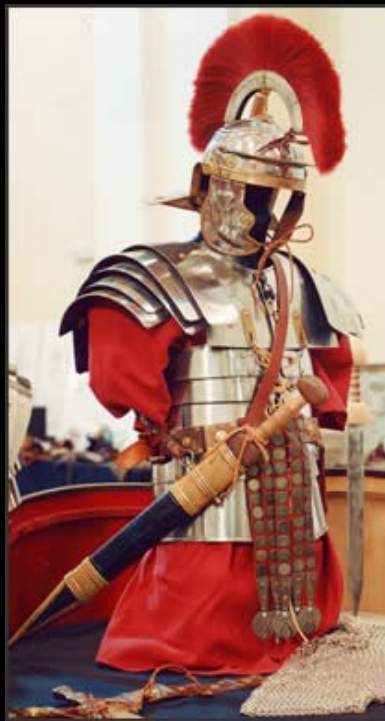
FOTO: Riproduzione di armatura e armi di centurione