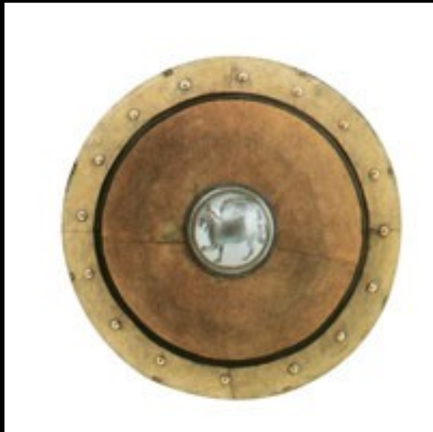
Scudo greco X-VII secolo a.C.

I primi scudi degli antichi Romani erano quelli che utilizzavano anche i Greci e gli Etruschi; erano scudi tondi e molto pesanti che coprivano abbastanza bene il busto, ma erano comunque poco maneggevoli .