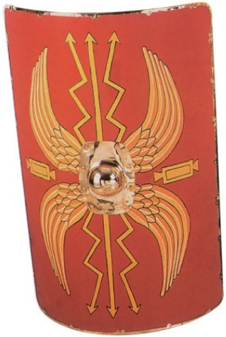
Scutum romano I- III secolo d.C.

Successivamente, fu introdotto lo scudo di forma rettangolare , con il quale i legionari formavano le famose “testuggini”. Veniva realizzato con più strati di legno incollati tra loro e rivestito in cuoio, con i bordi rinforzati in bronzo. Lo strato esterno era in tessuto, dipinto con colorazioni e simboli differenti a seconda dell'unità che rappresentava.