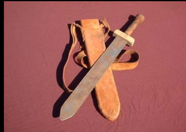
Gladio del legionario

Prendete ... la spada dello Spirito, che è la Parola di Dio ( Efesini 6:17 ).