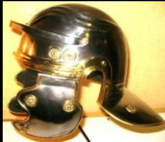
Elmo di legionario romano

Prendete anche l' elmo della salvezza... ( Efesini 6:17; I Tess. 5:8; Isaia 59:17 )